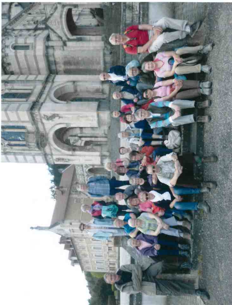
06 avril 2004 Journée Rencontre à Domrémy Le groupe des participants