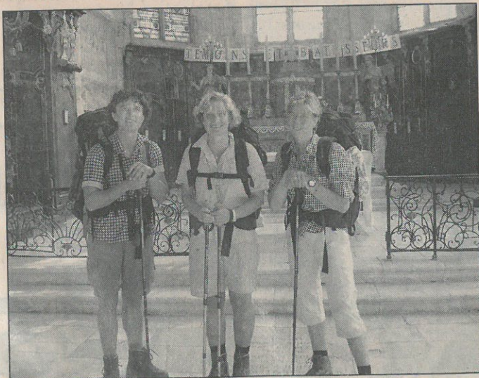
Halte à Blénod-lès-Toul et visite de l'église.

En 2005, elles envisagent de faire le tronçon Autreville-Lyon et l'année suivante Lyon - Le Puy. Le terme est programmé vers 2010. Qu'importe, elles ont la volonté et savent qu'elles arriveront un jour.