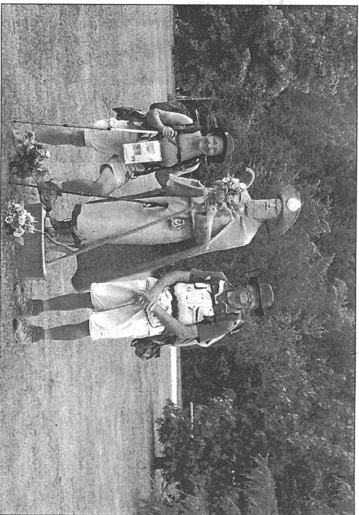
Le couple de Francheville, aux côtés de la statue du Pèlerin, dans le parc de L'Hôpital d'Orion, dans le Béarn.

L'avoir « fait », mais insistent pour dire que la longue marche vers Saint-Jacques est accessible au plus grand nombre. A condition d'être en bonne condition physique, et de disposer d'un budget d'environ 30 € par personne et par jour. (Nourriture et hébergement compris). Car le pèlerinage à Saint-Jacques, c'est d'abord et avant tout un quotidien qui se nourrit d'efforts, de simplicité et d'humili-