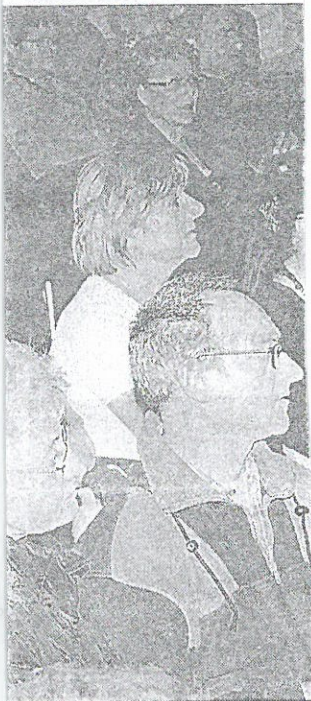
Saint-Jacques de Compostelle

es vocations ? C'est possible. Mais toujours est-il qu'un certain nombre de nos concitoyens ont déjà effectué ce pèlerinage.