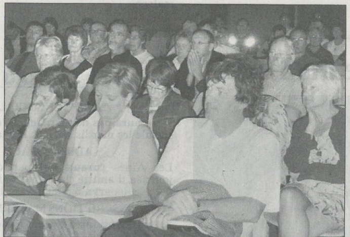
Jacquets et partants étaient nombreux.

d'incroyants, recevait non seulement des conseils techniques sur la préparation, sur l'équipement nécessaire ou les trucs à connaître avant d'entamer ce pèlerinage de près de 1.600 km, mais également pour s'interroger sur les motivations du pèlerin, les chemins à prendre, les périodicités ou les étapes à choisir.