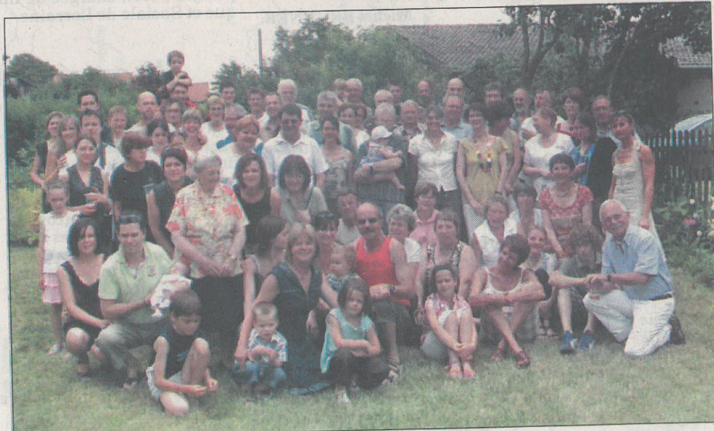
Famille, amis, tous réunis autour des marcheurs.