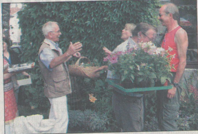
Vous ici ! Quelle surprise !

Ce grand moment d'émotion passé, les jeunes de la famille se sont affairés afin