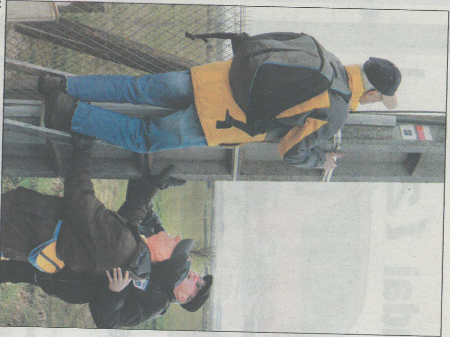
Un travail de longue haleine.

Comme pour le GR5F, ils en ont l'entretien.