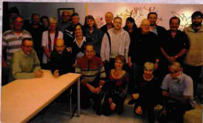
Évocation de souvenirs et échange de conseils étaient à l'ordre du jour de la réunion des Amis de saint Jacques de Compostelle.