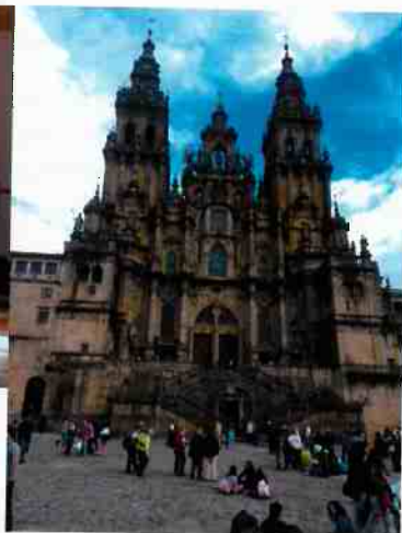
octobre 2012, Devant la façade baroque de la cathédrale de Santiago, la place de l'Obradoiro.