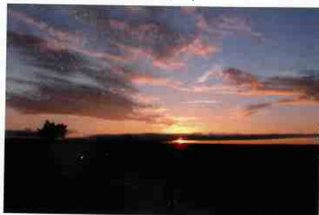
Septembre 2012, Lever de soleil sur la Meseta après Terradillos del Templarios (Castille, Espagne)