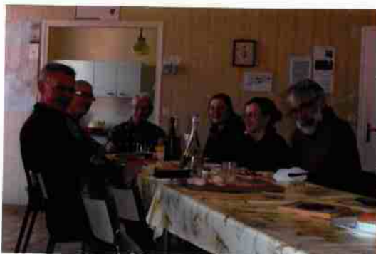
Avril 2012, dans le gîte communal de Miramont-Sensacq et Bernard, deux hospitaliers "se sont pliés en quatre" pour nous faire oublier la pluie de la journée !