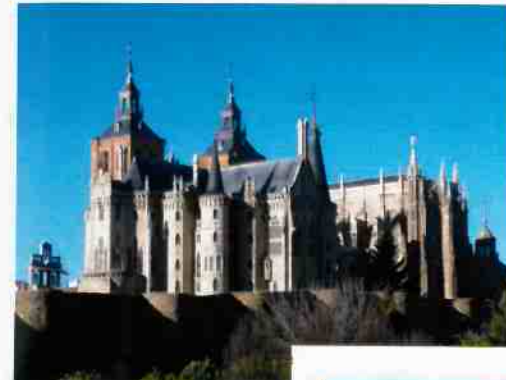
ASTORGA Le palais de Gaudi et la cathédrale