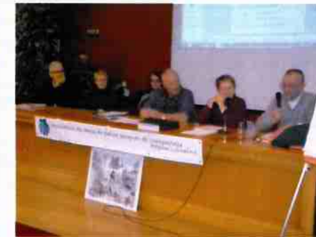
A la tribune