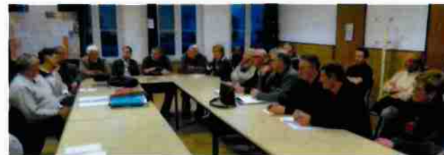
Réunion d'information à Mégange en 2014

Lors de la délivrance des credentials, nous remettons notre « petit guide pratique ». L'édition 2015 de ce petit guide est en préparation et comportera désormais en introduction une présentation de Saint Jacques, tant il est vrai que l'on a découvert que certains arrivaient à Compostelle sans savoir qui était Saint Jacques. !!!