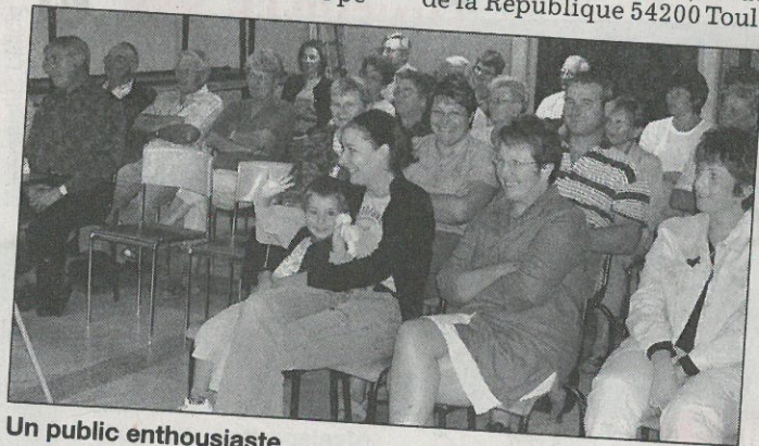
Un public enthousiaste.

Association : Les amis de Saint-Jacques-de-Compostelle, région Lorraine, 6 rue de la République 54200 Toul.