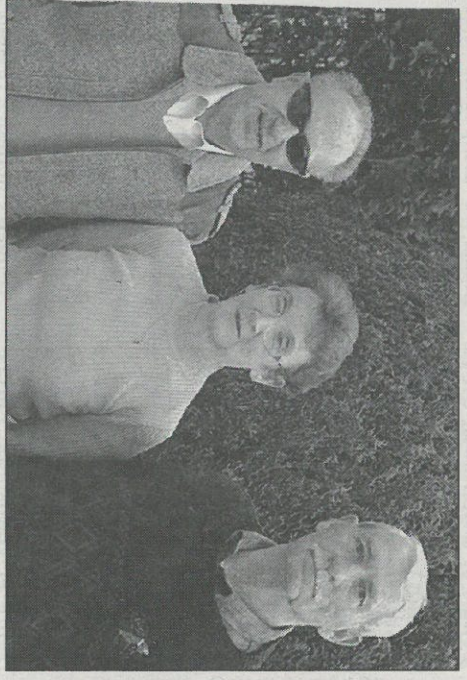
Trois pèlerins prêts à reprendre la route.

Une ville située au nord-ouest de l'Espagne constituait avec Rome le plus important pèlerinage du Moyen Âge. Des dizaines de milliers de pèlerins, appelés des Jacques, convergent, à pieds, vers le tombeau de Saint-Jacques de Compostelle à Santiago. Après une période d'oubli, les chemins de Saint-Jacques retrouvent une réelle vitalité. Quatre sentiers se réunissent en un chemin unique à Roncevaux jusqu'au tombeau du saint. Pour les populations de l'Est et du Nord, le sentier le plus connu et le plus emprunté est celui qui commence au Puy-en-Velay. Le sentier de grandes randonnées, le