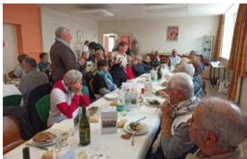
La secrétaire de séance

L'ordre du jour étant épuisé et avant de partager apéritif et repas, le président clôt la séance en remerciant les participants de leur présence et soutien qui sont un beau cadeau fait à notre association dans sa démarche, sans faille, depuis plus de 20 ans, d'accompagnement des personnes désireuses de se rendre à Compostelle.