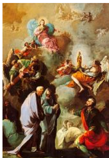
Apparition de la Vierge du Pilar à St-Jacques et ses disciples. Cathédrale de Saragosse.