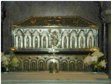
Tombeau de l'apôtre Saint-Jacques le Majeur.