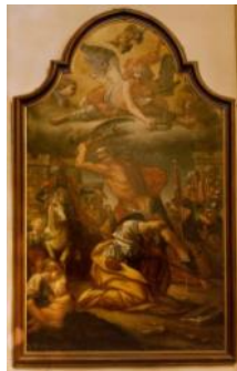
Décollation de Saint Jacques Le Majeur. 1719. Ancienne Collégiale St-Thiebault

C'est aussi l'Annonciation à la Vierge le même jour. Cette date est la conséquence de la fixation de Noël le 25 décembre par Jules Ier (vers 550 environ). A l'origine c'était les Saturnales mais aussi la fête de Mithra, la naissance du Soleil.