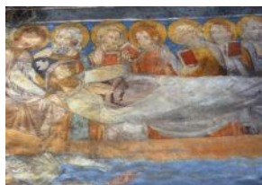
Translation de Saint-Jacques. Fresque de l'église Notre-Dame du Bourg. RABASTENS. -81 Tarn

C'est Saint-Jérôme qui dans son martyrologe a écrit qu'à cette date eut lieu la translation de sa dépouille d'Iria à Compostelle.